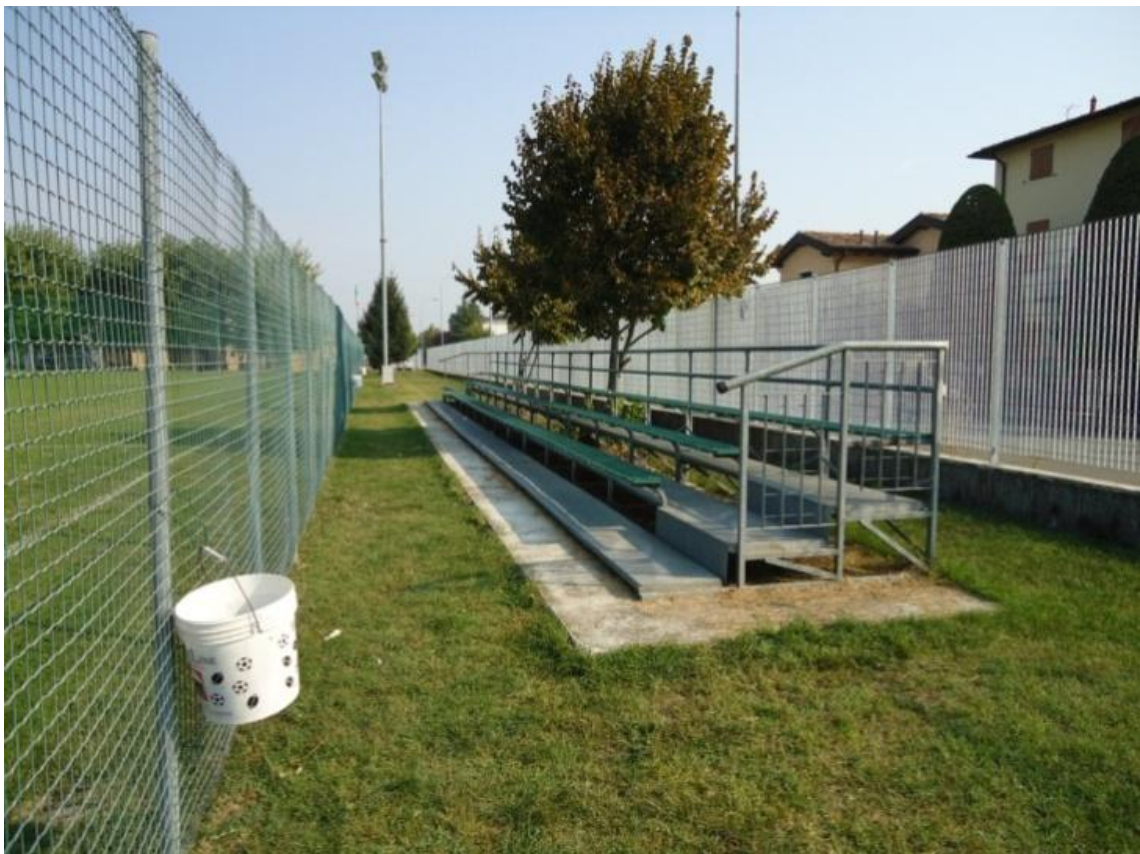
Campo di calcio "Lari" - Via Fano n. 27 - Reggio Emilia;