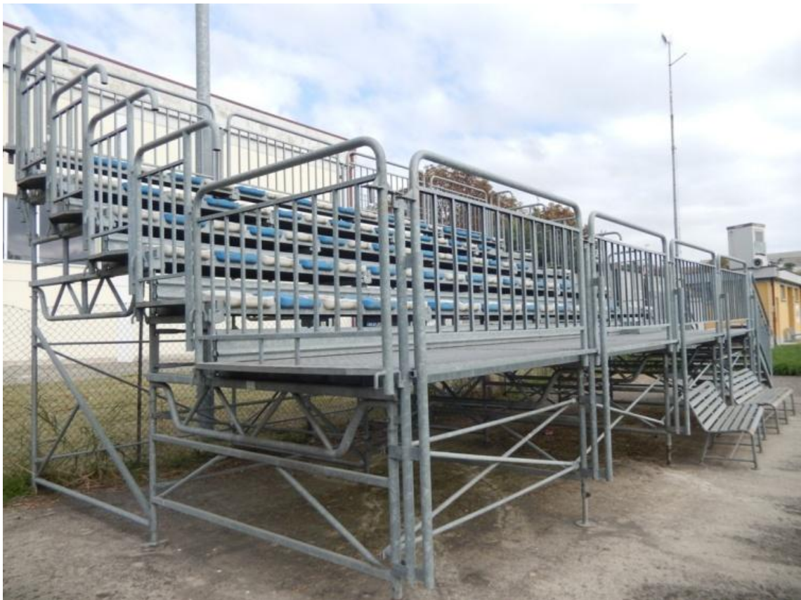
Campo di calcio "S. Prospero" - Via Allende n. 5 - Loc. San Prospero (RE);