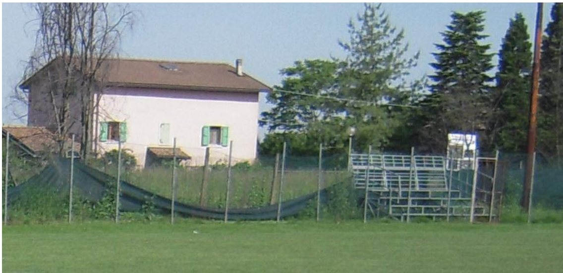
Campo di calcio "Gino Cabassi" - Via Beethoven n. 78/c – Loc. Massenzatico (RE)