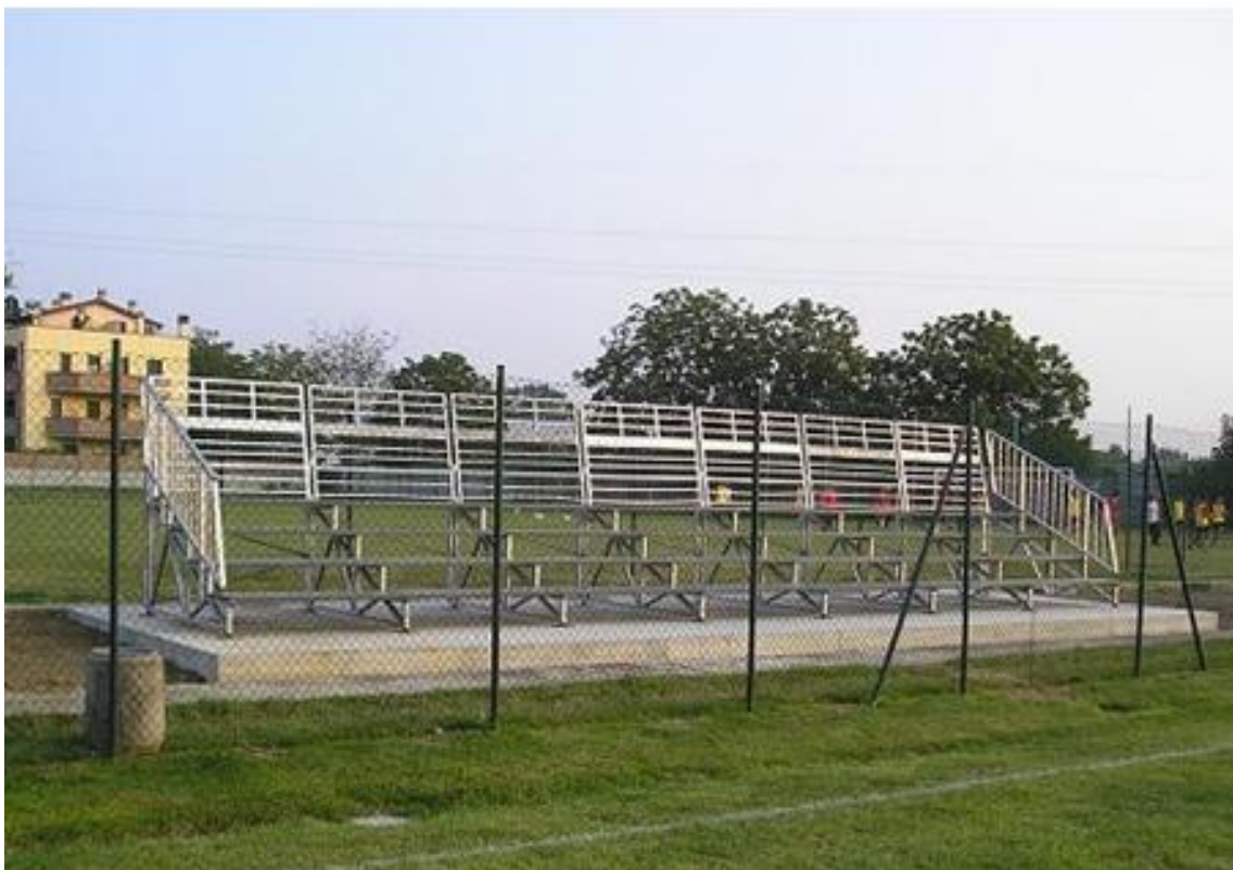
Campo di calcio "Cesare Campioli" - Via C. Campioli n. 11/a - Loc. Cavazzoli (RE);