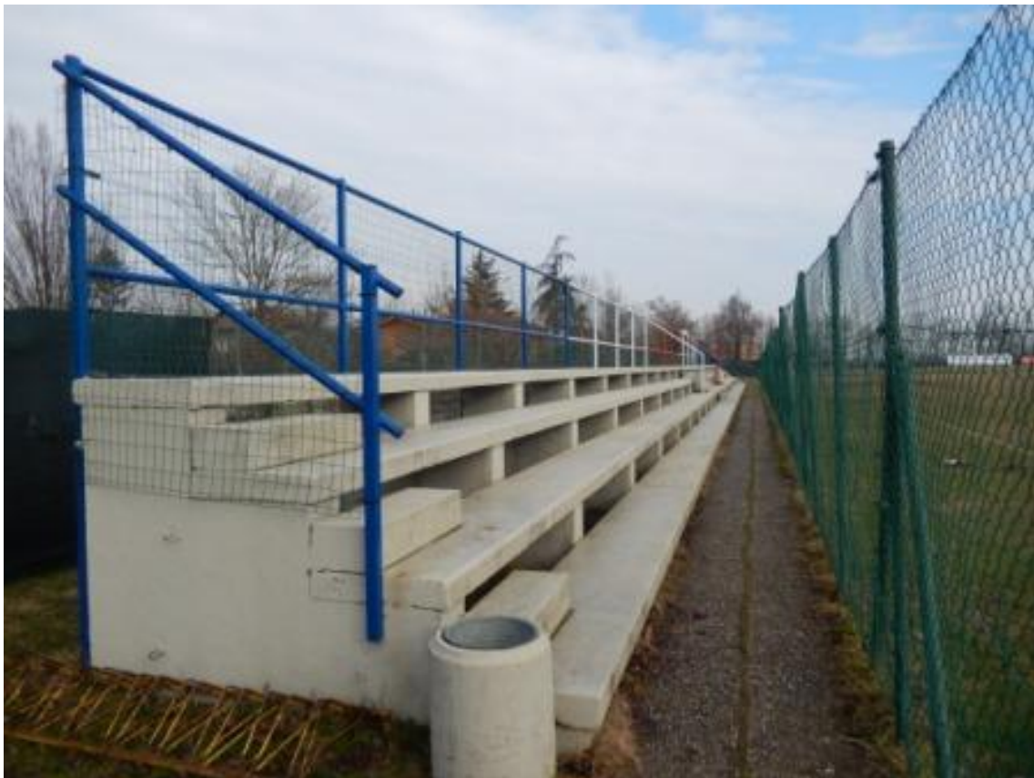
Campo di calcio "Villa Cella" - Via Cella all'Oldo n. 11 - Reggio Emilia.